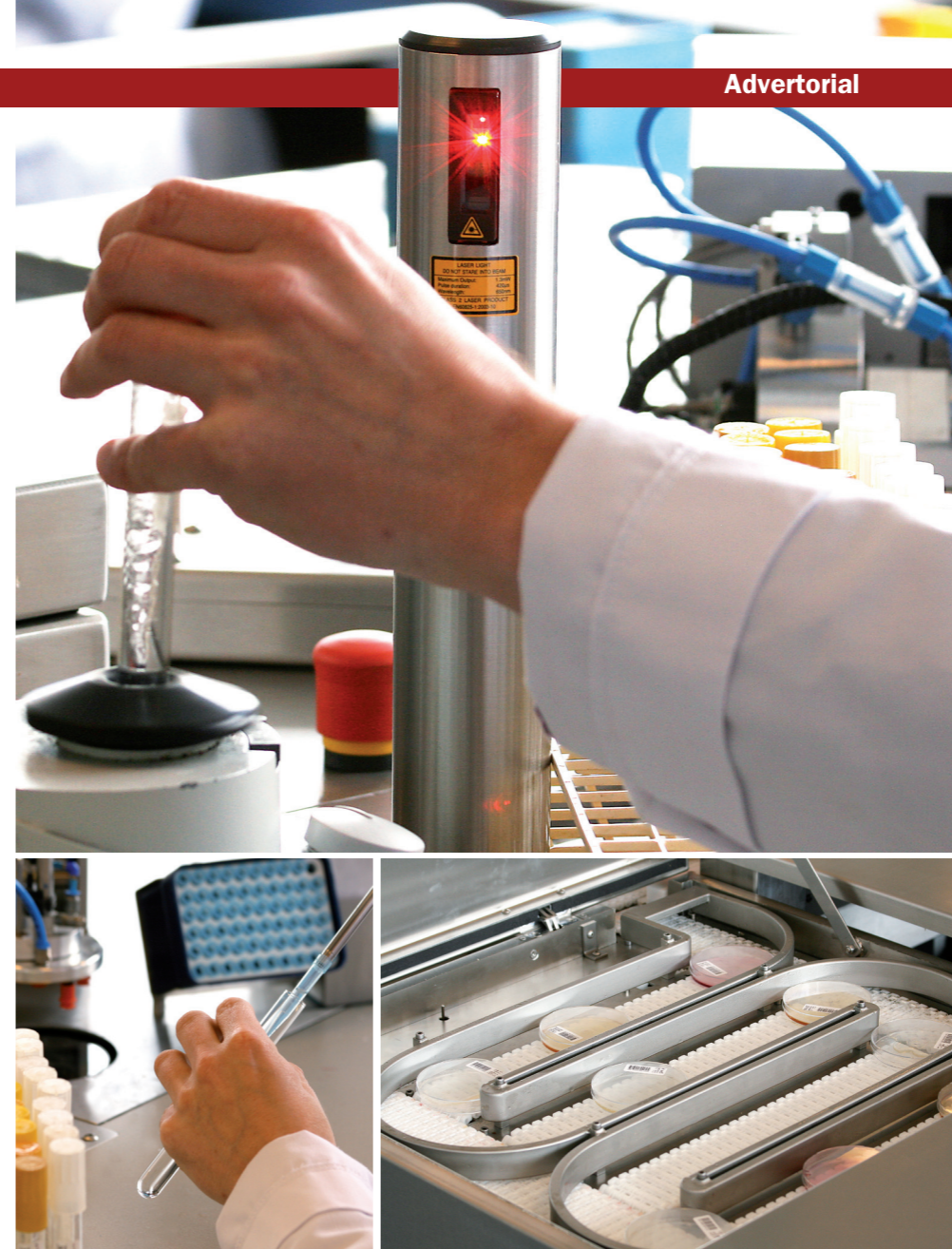
Boven: Zo draait de PK uitplaatmachine nu bij SGS in Spijkenisse.