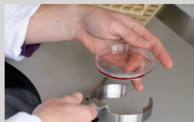
Het 'pannetje' om speciale bepalingen tussen routinebepalingen te voegen.